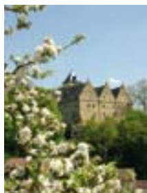
Schloss Mainberg und ...

danach durch die freie Landschaft des Schlettach und schließlich wieder durch den Wald zum Main zurück.