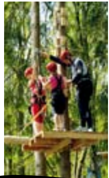
Ellertshäuser See, Hochseilgarten