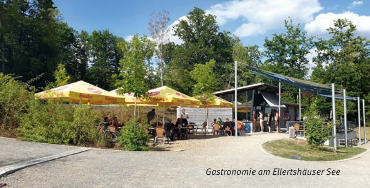
Gastronomie am Ellertshäuser See