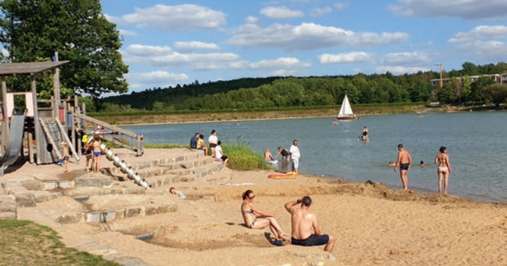
Badespaß am Ellertshäuser See